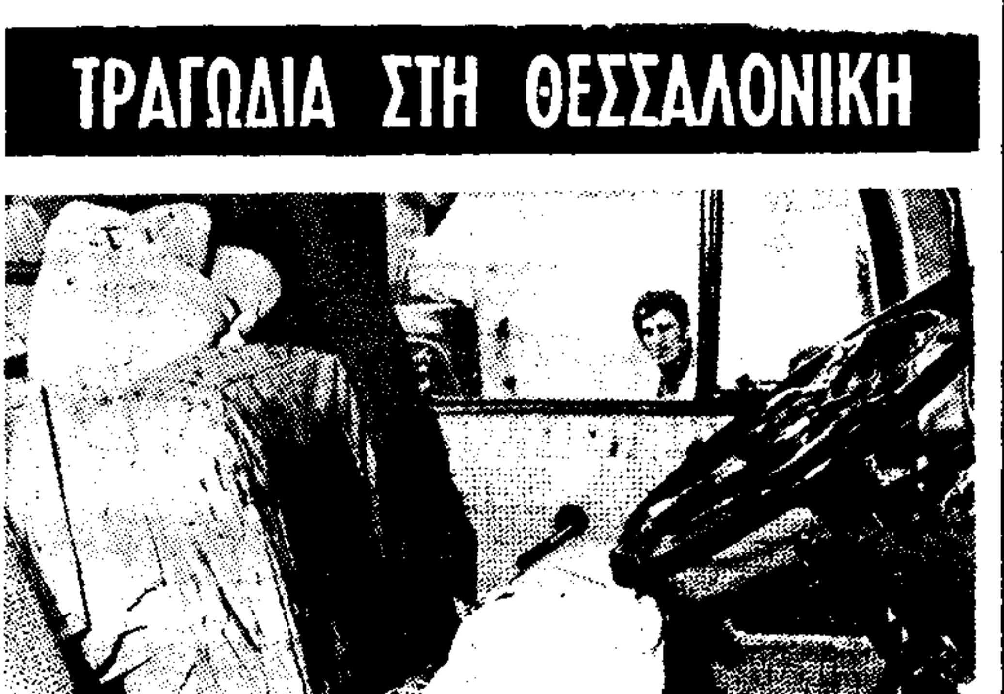
Το λυσιτελέσιο του αυτοκινήτου του δρόμου 'Αθ. Σταυράκη, ενόσω το όποιον ατύχησε μετά τον φόνο της Δάσκινας Παπαμιώλη. Διακρίνονται τα αίματα άνω στα καθίσματα.