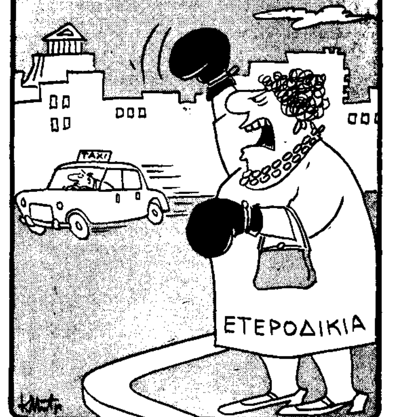
Ταξι... ταξι!...